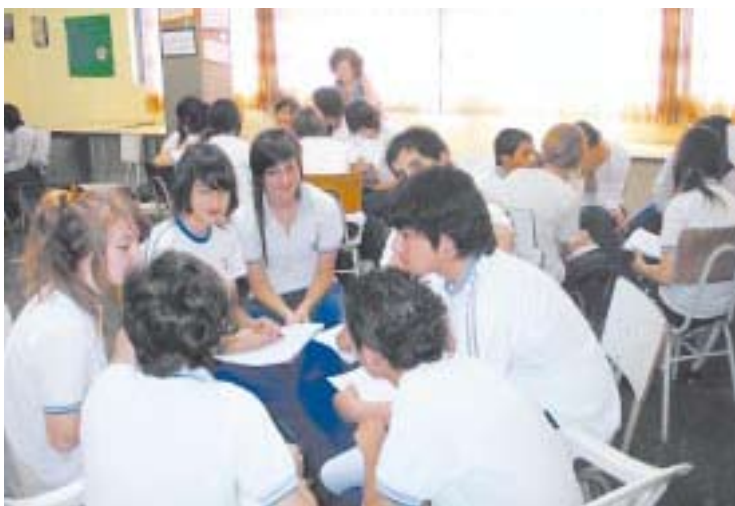
AGENDA. EL PROGRAMA "WALLENBERG EN LA ESCUELA" ESTA EN LAS AULAS.