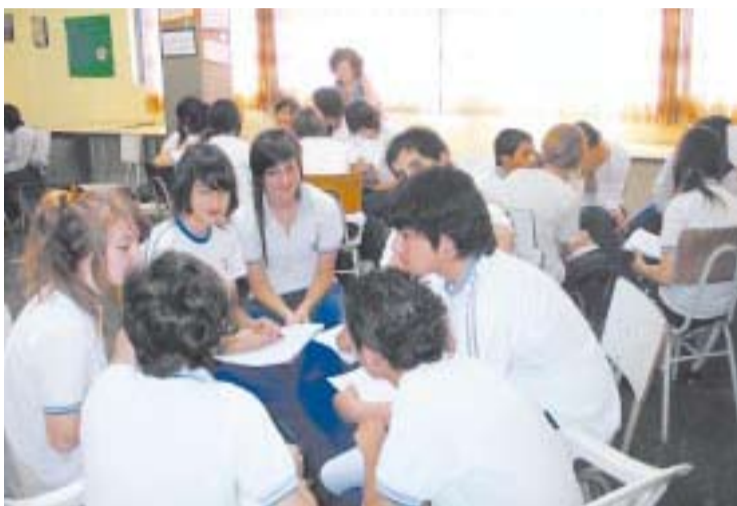
AGENDA. EL PROGRAMA "WALLENBERG EN LA ESCUELA" ESTA EN LAS AULAS.