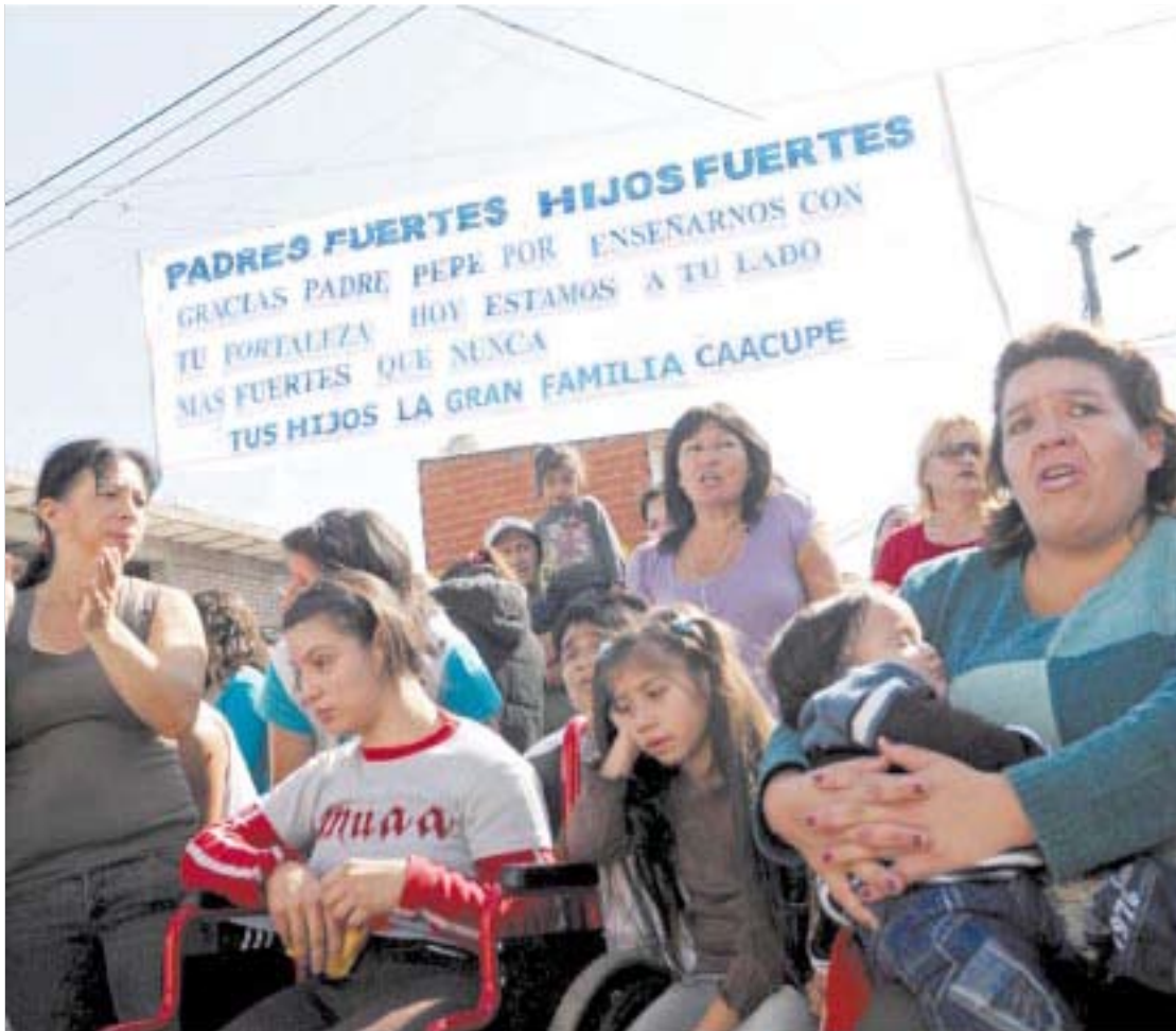
EL CARIÑO DE LOS FELIGRESES. LOS FIELES DE LA PARROQUIA DE CAACUPE Y OTROS VECINOS DE LA VILLA SE CONGREGARON PARA DAR SU SOLIDARIDAD AL PADRE "PEPE" POR LAS AMENAZAS EN CONTRA DEL SACERDOTE.

-Di Paola: Somos hijos de aquel movimiento porque allí actuó el padre Carlos Mugica y sus compañeros y se inició una corriente de curas para las villas. Nos sentimos herederos de esa linda tradición, pero con los desafíos de hoy.