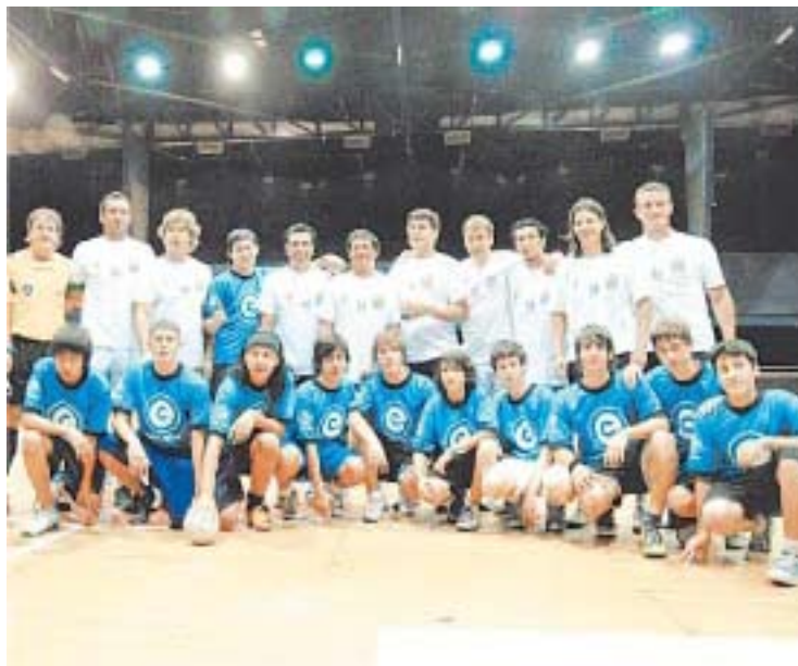
LA PELOTA NO SE MANCHA. EN ESTE EQUIPO CABEN TODOS, SIN DIFERENCIAS.

Para esta iniciativa se integran, en un solo equipo, chicos de dos distritos escolares con diferente nivel económico y social, elegi-