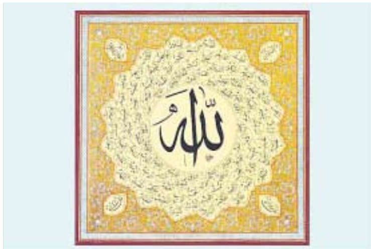
SEÑOR ABSOLUTO. DIOS NO HA ENGENDRADO NI HA SIDO ENGENDRADO.

Los coetáneos del profeta Muhammad le preguntaron acerca de