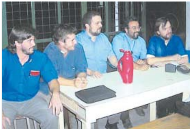
MANO A MANO. LOS CURAS VILLEROS EN LA CHARLA CON VALORES RELIGIOSOS.