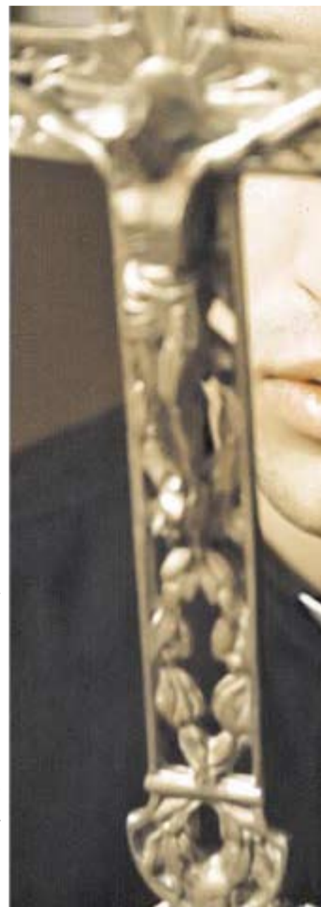
UN COMPROMISO EXIGENTE. EL CELIBATO, DICE

pectiva más general. "Es una simplificación pensar que la continencia sexual es la productora de perversiones", dice. Con respecto a la pedofilia ligada específicamente al celibato, señala que "el abusador de menores más frecuente, según las estadísticas, es el padrastro y la mayoría de esas depravaciones se dan en el seno familiar o en sus relaciones más cercanas. De acuer-