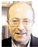
SASSI. DIOS NOS HABLA SIEMPRE.

Por qué pensar que Dios tiene un lugar privilegiado en una parroquia, para encontrarlo? Dios es un poquito como la comunicación,