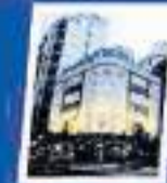
HOTEL S.U.T.E.C.B.A. Mar del Plata