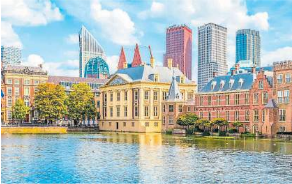
En la actualidad. La ciudad holandesa de La Haya donde se editó la mejor versión de la Biblioteca Oriental.