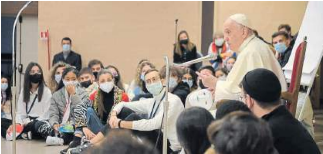
En clase. Francisco junto a los futuros dirigentes que se formarán en política durante los próximos 15 meses.

El Papa inauguró un curso de formación política. Participan 50 menores de 30 años de los cinco continentes.