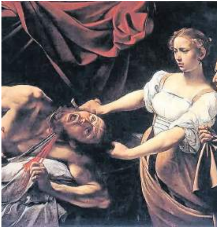
Acción heroica. La joven salvó a su pueblo gracias a su fe y su astucia.

Luego de orar pidiendo la protección de Dios, la viuda se vistió con sus mejores ropas y joyas, se peinó y perfumó realizando toda su hermosura, y se marchó de la ciudad hacia el campamento enemigo.