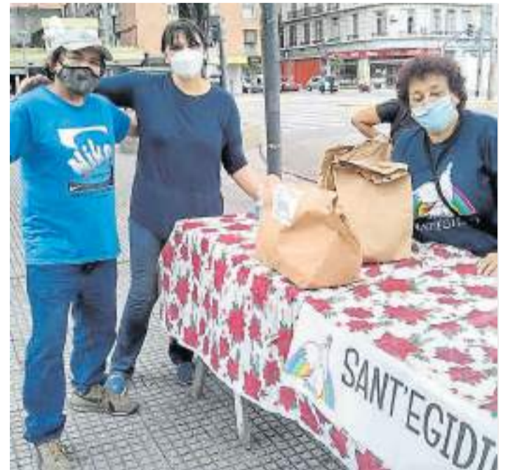
Comunidad de San Egidio. La encargada de repartir los alimentos.