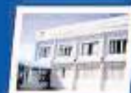
HOTEL "EVA PERÓN" San Clemente del Tuyú