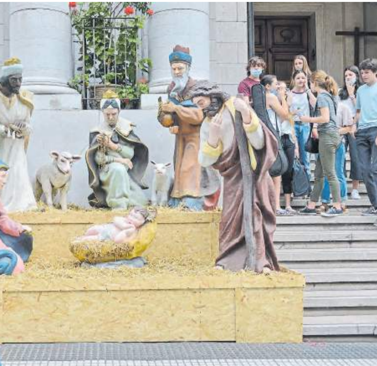
El pesebre puesto en las escalinatas de la iglesia de San Nicolás de Bari sobre la avenida Santa Fe capta la atención.