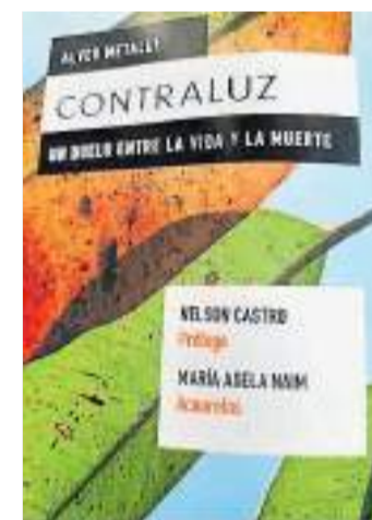
Vivencias. Libro que emociona.