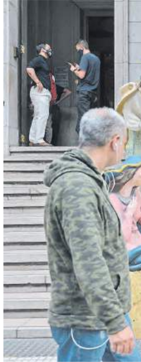
Visibilidad de la evocación religiosa. El pe...

Más allá de los signos externos, es clave que los creyentes abran su corazón. El Papa también lo mencionó al recibir los principales símbolos. "El árbol y el pesebre -dijo- nos introducen en el típico ambiente navideño que forma parte del patrimonio de nuestras comunidades: un ambien-