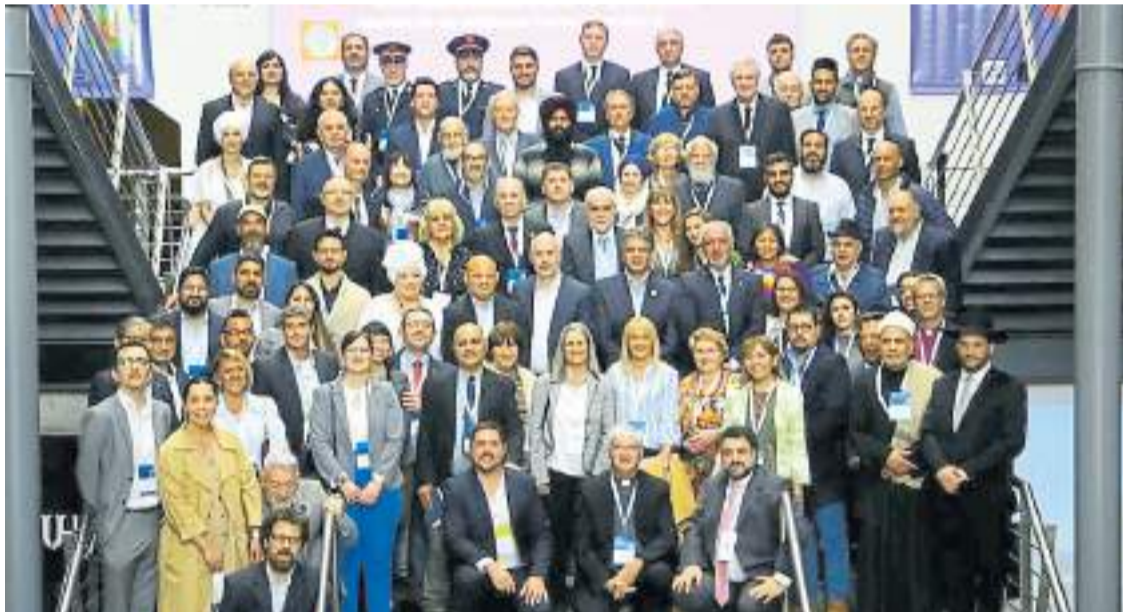
Unidos. Exponentes de los credos demostraron que su convivencia puede traducirse en tareas concretas.

Convocados por el Gobierno de la Ciudad de Buenos Aires , los líderes de los credos y dirigentes de comunidades de fe debatieron en grupo y en plenarios durante una jornada en la Usina del Arte, en el barrio porteño de La Boca. En la declaración final proponen ante todo que "el modelo de diálogo interreligioso sea usado