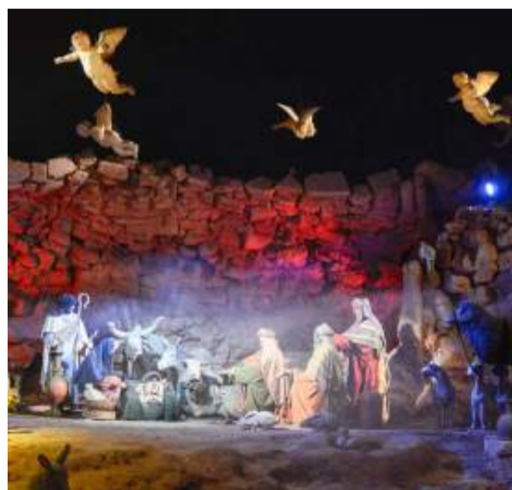
Navidad. Tierra Santa tiene el pesebre animado más grande del mundo.

te coloca papелitos doblados con sus plegarias y deseos, como es la tradición, luego se ponen en una urna que se envía a Jerusalén. “El parque tiene una mística muy especial, creo que está mantenido por el cariño de la gente de todos los credos. Después de 23 años, cuando entro y veo al Cristo sobre la montaña con sus brazos abiertos, me emociono y lloro”, señala su directora.