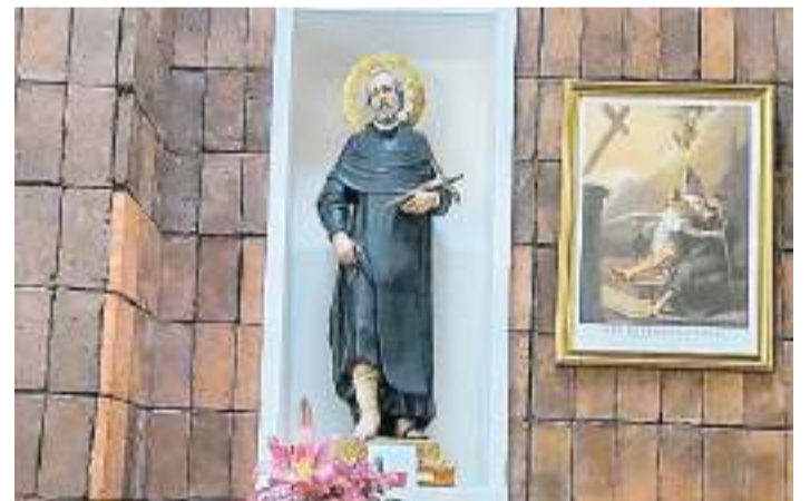
Imagen. San Peregrino Laziosi en la iglesia María Madre de la Iglesia

En la eucaristía del 1 de noviembre la iglesia estuvo repleta de gente y muchos de los presentes tuvieron que vivenciarla desde la calle. Antes de terminar la misa, una señora tomó el micrófono y relató su experiencia de sanación del cáncer de páncreas. También, se invitó a un último momento de oración: la adoración al Santísimo Sacramento. Al despedirse con una canción dedicada a San Peregrino, los asistentes recibieron la bendición, uno por uno,