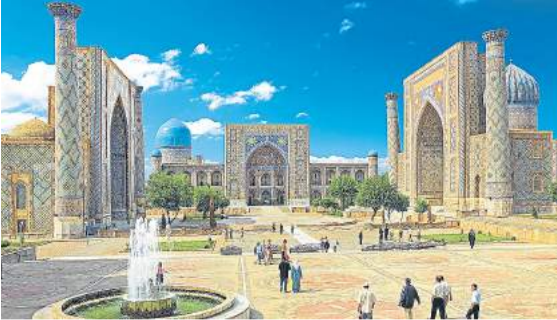
El Registán. De izquierda a derecha: las madrasas de Ulugh Beg, Tilia Kari y Shir Dar.