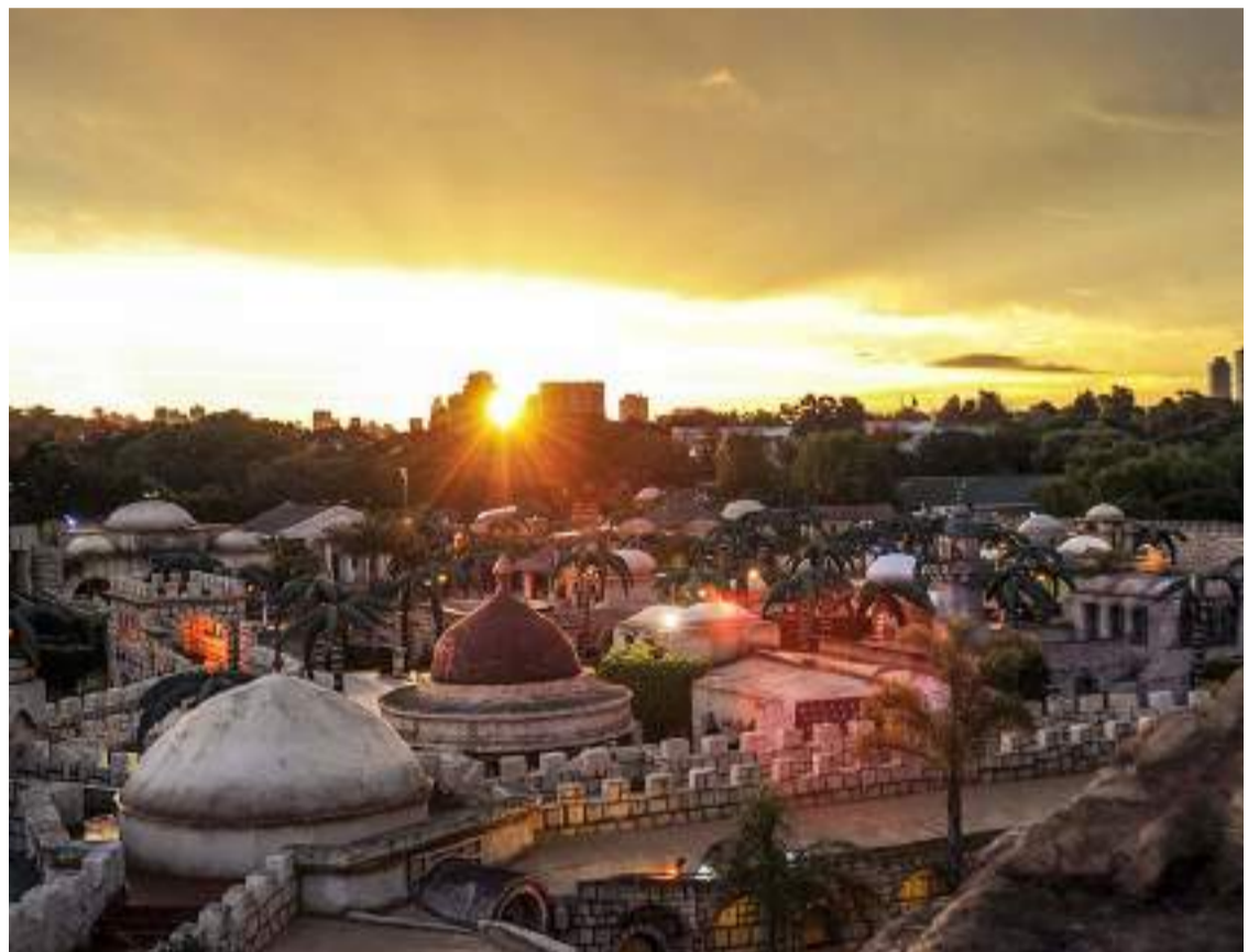
Jerusalén en miniatura. El parque temático reproduce las edificaciones y costumbres de la época de Jesús.

El itinerario comienza con la “Creación”, que describe el origen de la vida en la Tierra, para luego recrear el Pesebre animado más grande del mundo, con cientos de figuras de tamaño real, que de cara a la próxima Navidad cobran especial relevancia. Además de la Creación y el Pesebre, la “Última Cena”, es uno de los momentos más emocionantes de la visita, donde se ve a una reproducción de Jesús, sentado a la mesa junto a sus doce apóstoles. En otro espacio, una réplica del Muro de los Lamentos que está en Israel se convierte en un lugar de oración. Allí, entre los ladrillos, la gen-