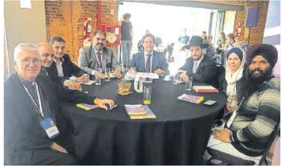
Diálogos. Los religiosos trabajaron previamente en grupos definiendo las propuestas.