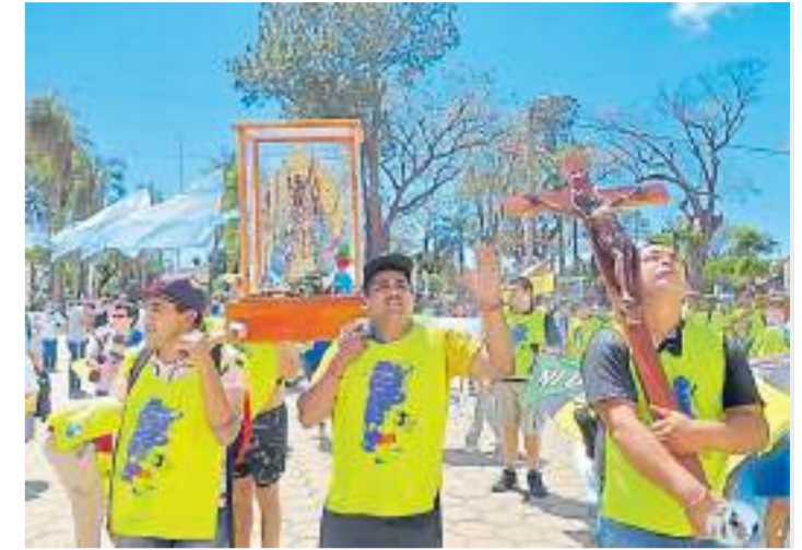
Fervor. Los peregrinos al llegar al santuario de Itatí, en Corrientes.