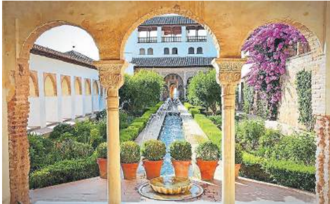
Jardines. Vista del Pabellón Sur del Patio de la Acequia del Generalife, en la Alhambra de Granada.