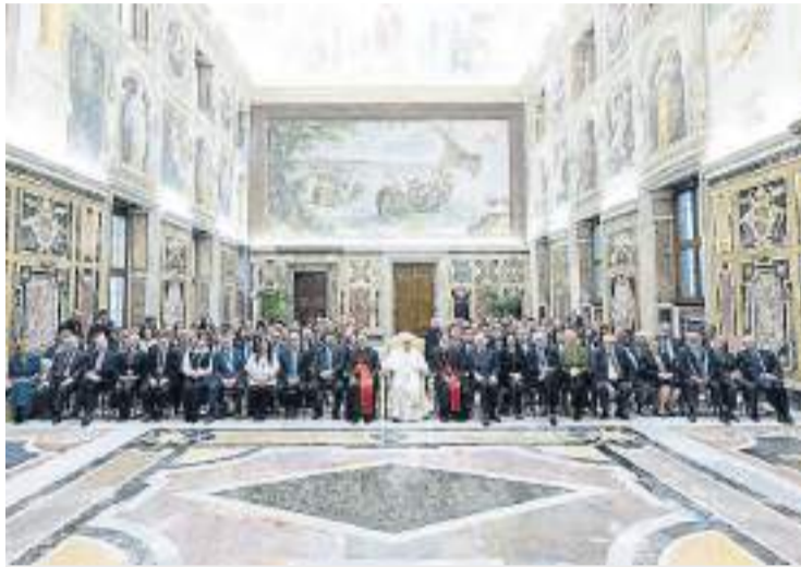
Vaticano. Dos cardenales y el papa Francisco junto al Congreso Judío.

El motivo no era para nada menor. En la sesión se aprobó un documento preliminar llamado "Kishreinu" -un vocablo hebreo que significa "Nuestro Vínculo"- para que después de ser evaluado y corregido por las comuni-