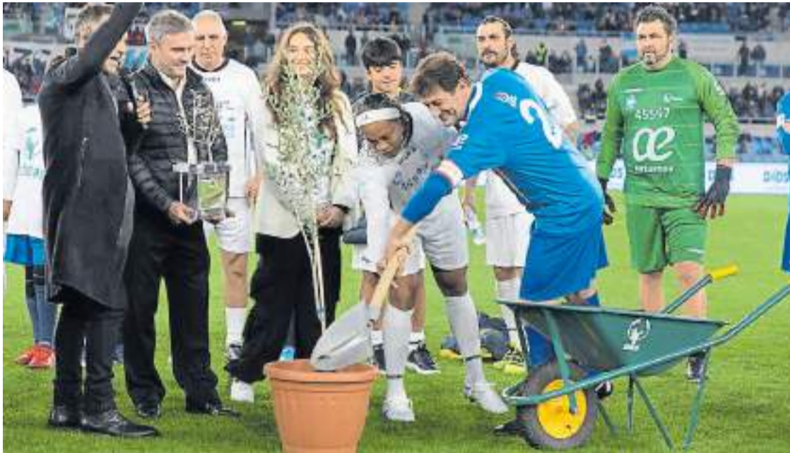
Gesto. Como es costumbre en este evento, dos jugadores plantaron un árbol de olivo al terminar el partido.

Organizado por Scholas Occurrentes, reunió a varios astros. El Papa pidió cuidar la esencia de ese deporte.