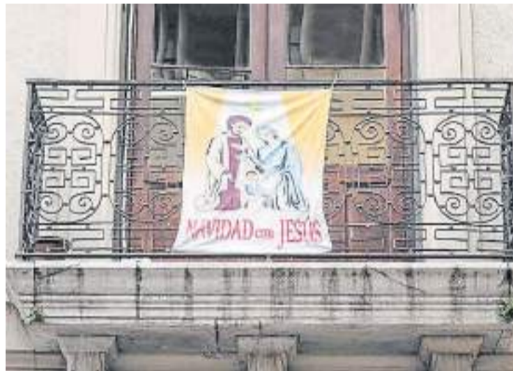
Montevideo. Imágenes que representan la Navidad en los balcones.

visitar el Parque Tierra Santa , en la Costanera Norte, que abrirá los fines de semana de 12 a 22. El 25, se celebrará la Navidad con música y luces.