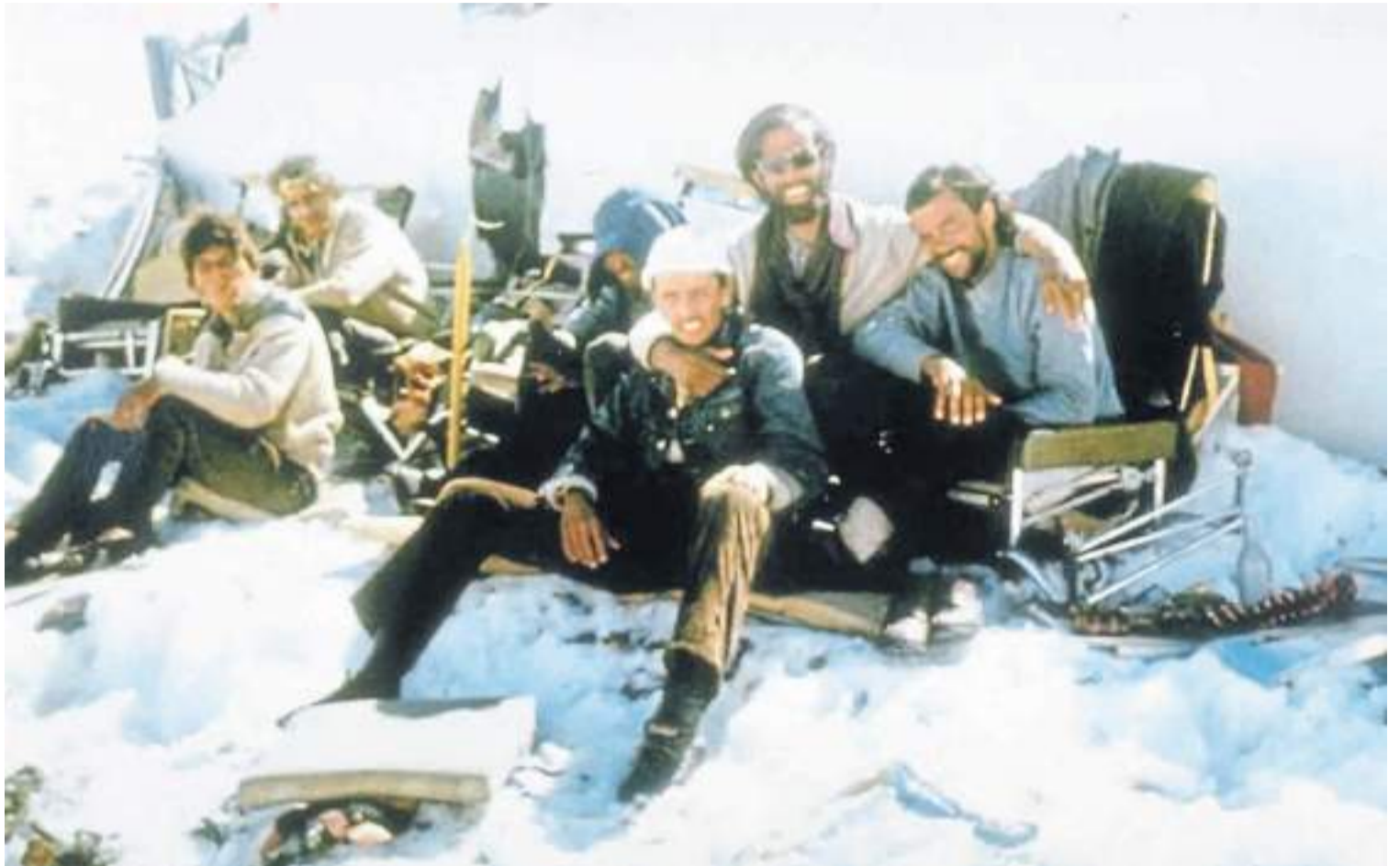
Unidos en una situación extrema. A pesar de que 13 murieron al estrellarse el avión y 16 en las semanas sucesivas, los restantes no se rindieron.

¿Cómo transitaron esos meses a pesar de la incertidumbre, el no saber si los iban a encontrar? Zerbino cuenta que "lo que a diario hacíamos era rezar el Rosario, conectándonos con la Virgen para agradecerle por el día que habíamos tenido o pedirle para mañana un día como este, a pesar de que habíamos tenido una avalancha en la que murieron ocho de los