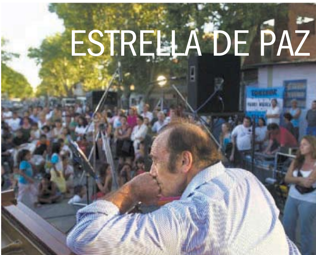
CONTRIBUCION. ESTRELLA PUSO SU ARTE AL SERVICIO DE LA DIGNIDAD HUMANA Y DE LA PACIFICACION.

Fue entonces cuando empezó a imaginar una orquesta palestino-judía. Integrada por cuarenta músicos de Israel, Irak, Jordania,