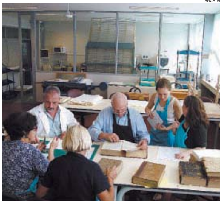
SANA...SANA. PAGINAS DE HACE TRES SIGLOS SON "CURADAS" Y QUEDAN NUEVAS.