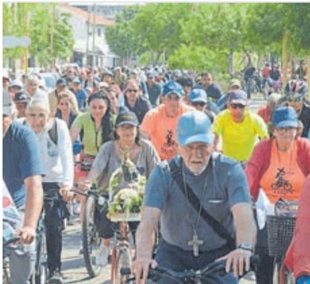
Formosa. Con 500 km de largo entró en el Récord Guinness.