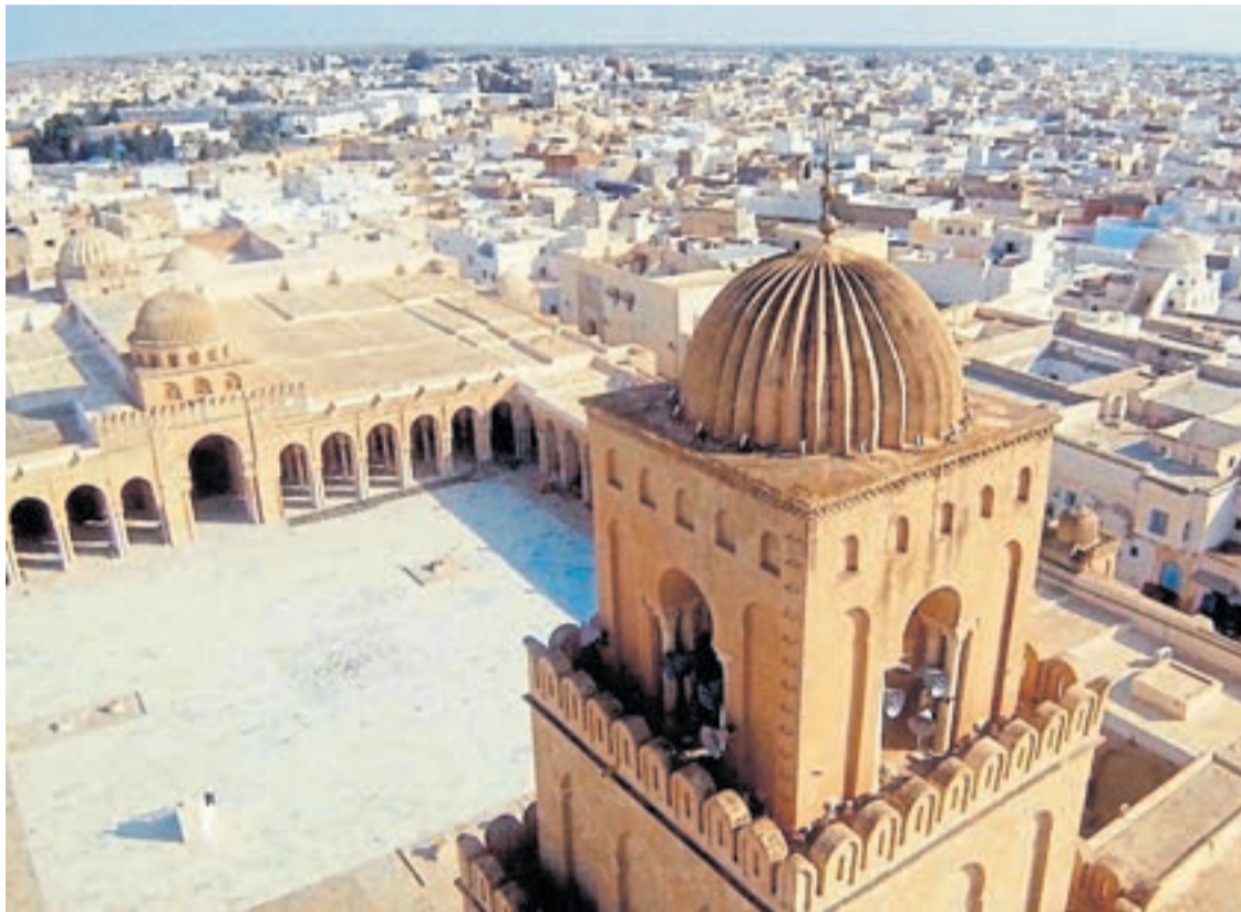
Qairuán, Túnez. Vista aérea de la Gran Mezquita, considerada el monumento cumbre de la dinastía aglabí.

La Mezquita Comunitaria de Qairuán es el monumento cumbre de la arquitectura aglabí. La ciudad de Qairuán se encuentra a 160 kilómetros al sur de la capital, Túnez. Se fundó sobre el emplazamiento de una pequeña mezquita fundada hacia 670 y fue completamente reedificada por Ziyadat Allah I (r. 817-838), el tercer emir aglabí de Ifriqiya, en el año 836. La sala hipóstila posee arquerías realizadas por la ca-