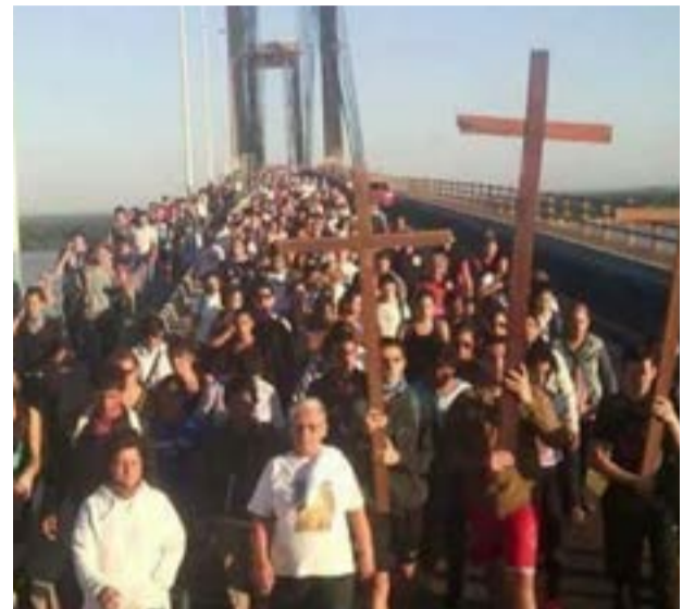
De Corrientes a Resistencia. Uniendo dos provincias.