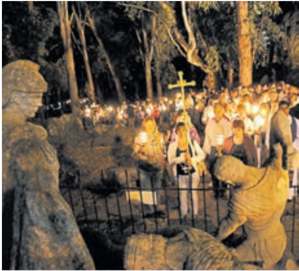
Tandil. Esta tercero en importancia a nivel mundial.