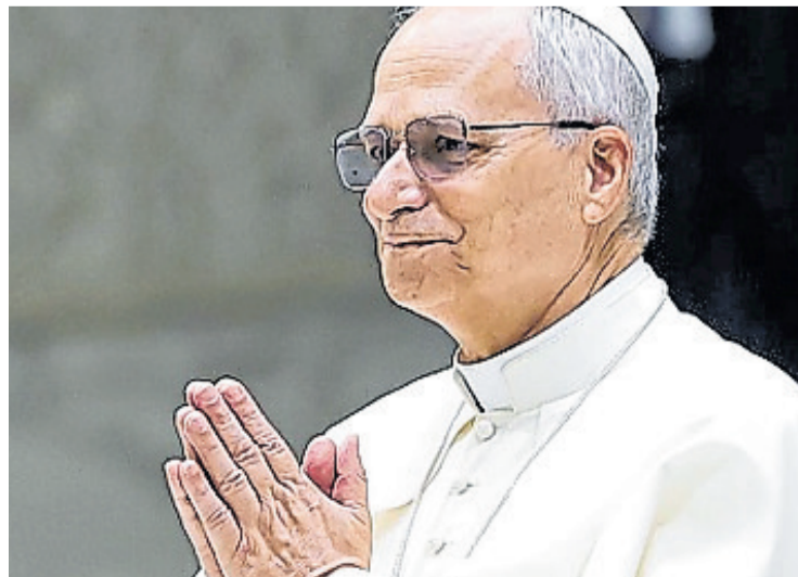
León XIV. Seguramente hará un enérgico llamado a la paz mundial.

El Viernes Santo, el pontífice presidirá la Celebración de la Pasión del Señor en la basílica de San Pedro a las 17. Este día la Iglesia no celebra la Eucaristía ni ningún sacramento a excepción de la Reconciliación y la Unción de los Enfermos. La celebración litúrgica conmemora la muerte del Señor, con la ado-