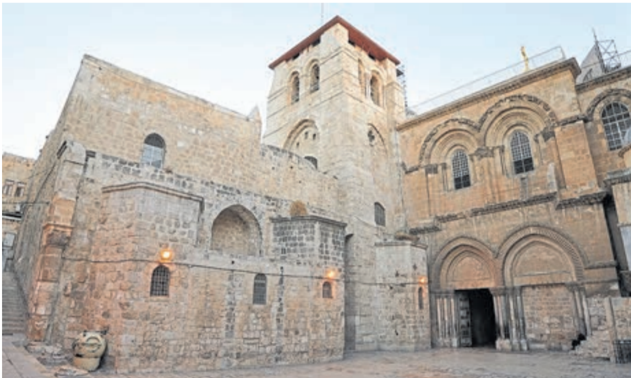
La Iglesia del Santo Sepulcro. Vacío porque toda la zona -incluido el Muro de los Lamentos y la mezquita- está cerrada.

(* El autor es escritor. El último libro publicado es "San Carlo Acutis".