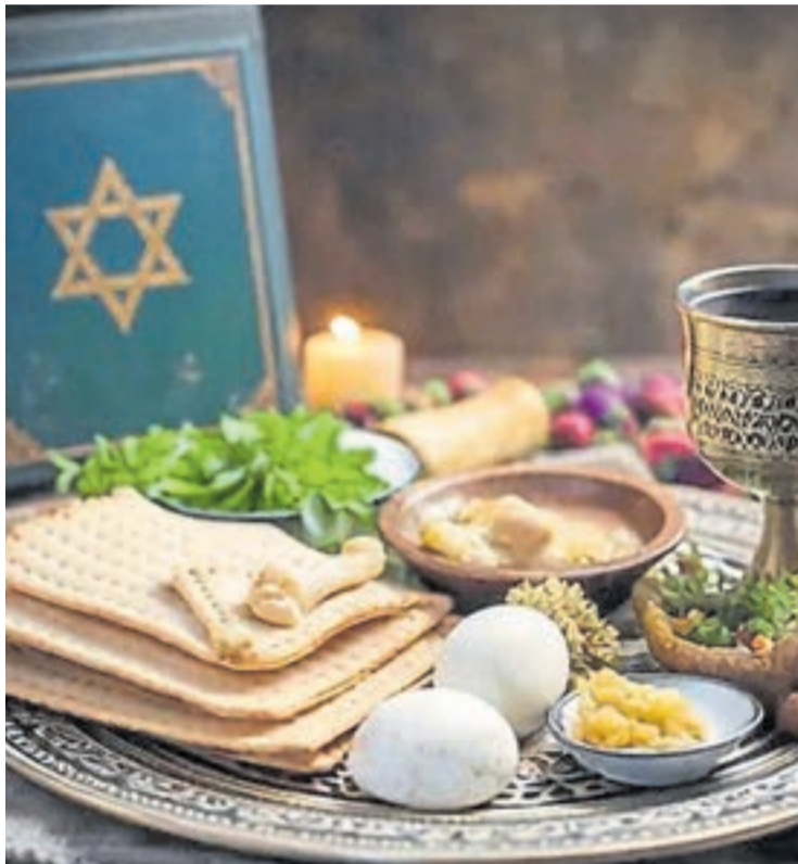
Característicos. Los alimentos conllevan un profundo significado.

El "Seder" de Pesaj, la cena inaugural de la conmemoración, constituye el eje pedagógico de estas observancias. A través de una secuencia ordenada se recrean los episodios del Éxodo, se degustan elementos cargados de significado como las hierbas amargas, que recuerdan la amargura de la opresión, o el "jaroset", elaborado con manzanas, nueces, vino y especias, que por su color remite al barro con que los hebreos fabricaban los ladrillos (para la construcción en Egipto), y se generan espacios de cuestionamiento, especialmente para los más jóvenes. No se trata solo de recordar, sino de narrar, inter-