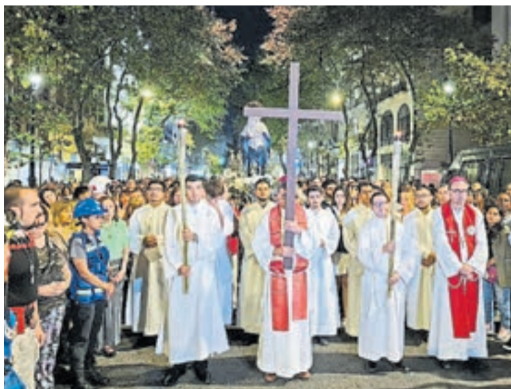
Vía Crucis de la Ciudad. Una tradición en derredor de Plaza de Mayo.

El Viernes Santo contará con diversas celebraciones litúrgicas a lo largo del día incluyendo la Liturgia