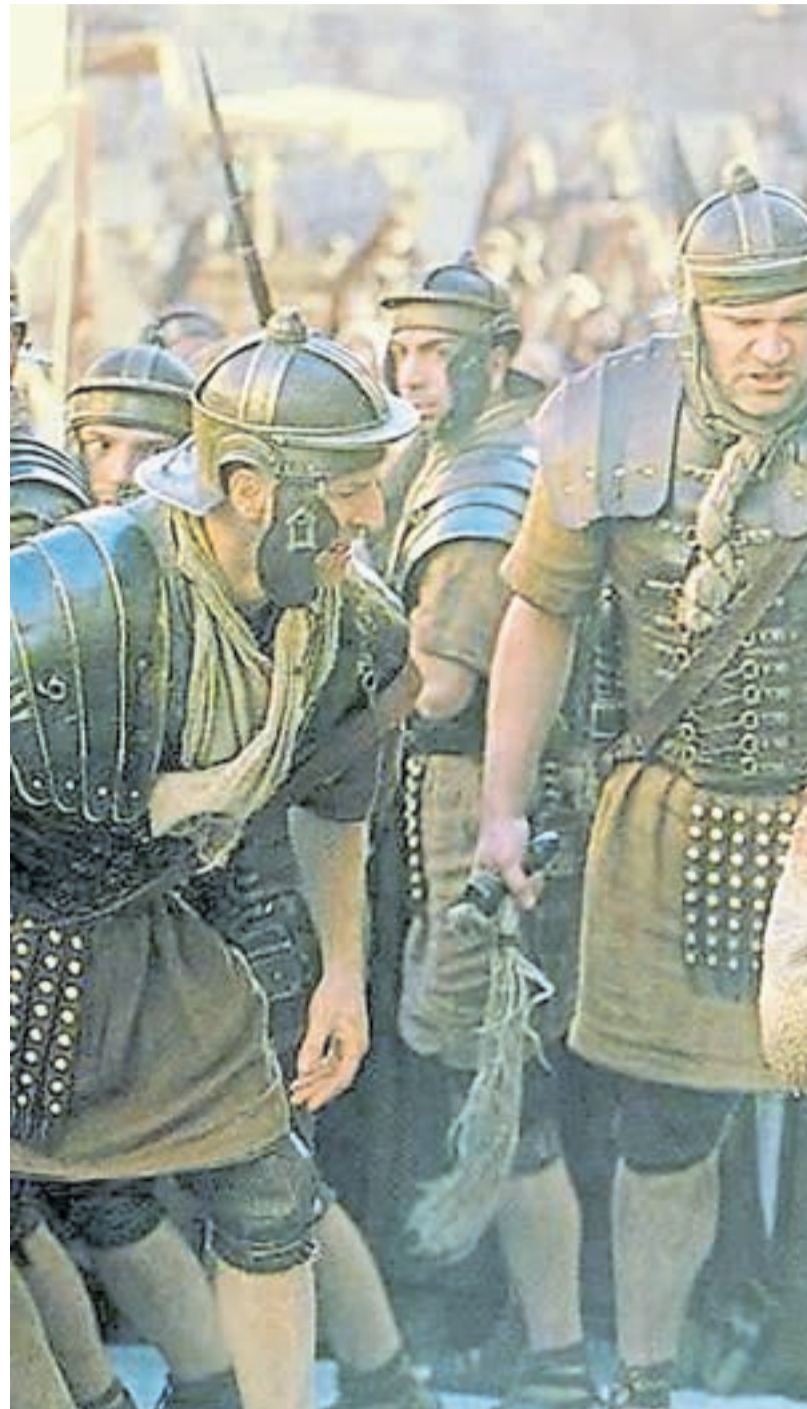
Castigo más duro. Una antigua ley judía establecía un máximo de 40 azotes, p

Los riñones ya no filtran, insuficiencia renal aguda. Se acumulan sustancias tóxicas en sangre. El shock circulatorio y la acumulación de sustancias tóxicas producen alteraciones neurológicas con un estado de alteración de la conciencia. Estupor, mareo y adormecimiento. El esfuerzo por respirar es intenso y dificultoso. Jesús debía “literalmente” pararse sobre el clavo de sus pies para poder respirar. La frecuencia respiratoria normal de 12 a 14 respiraciones por mi-