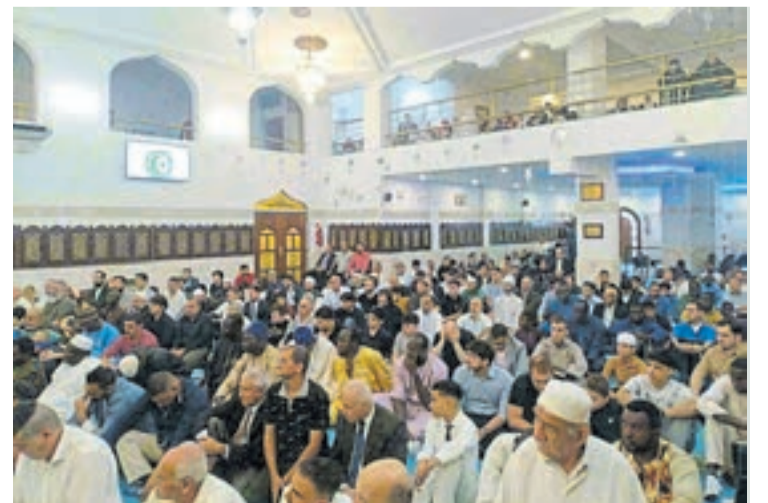
Numerosa participación. Con fraternidad y hondo sentido espiritual.

La celebración transcurrió en un marco de especial calidez y participación, reflejando no solo la relevancia espiritual del fin de Ramadán, sino también el aprecio y la cercanía que esta fecha suscita en amplios sectores de la sociedad.