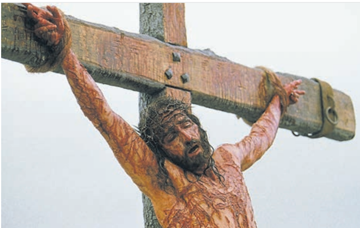
El final. Tras un colapso del funcionamiento de todo su cuerpo, la muerte de Jesús termina siendo por asfixia.