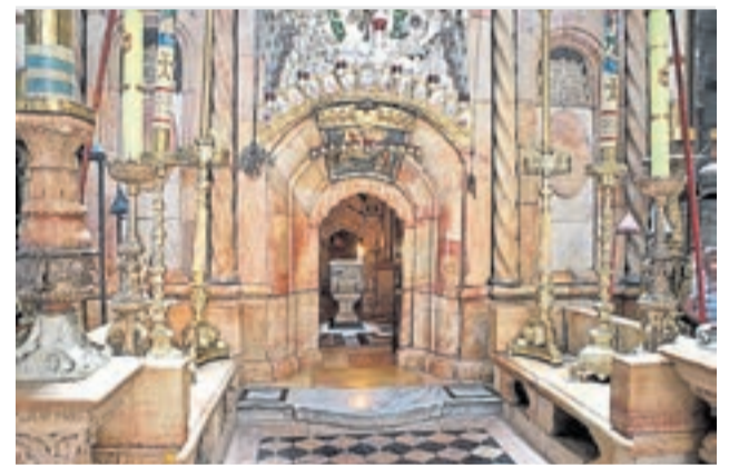
La tumba de Jesús. El corazón del templo ahora sin fieles.