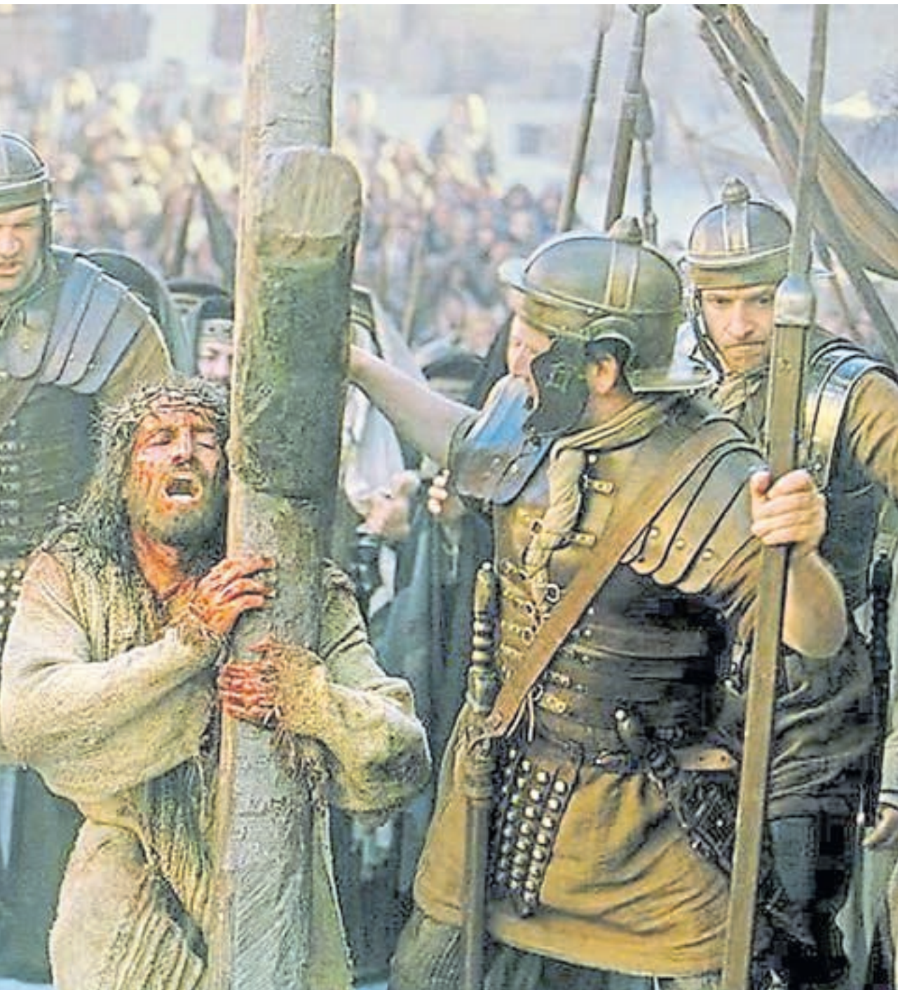
...es, pero sus verdugos no la tuvieron en cuenta. Las tiras del látigo tenían bolas de plomo o huesos en los extremos.