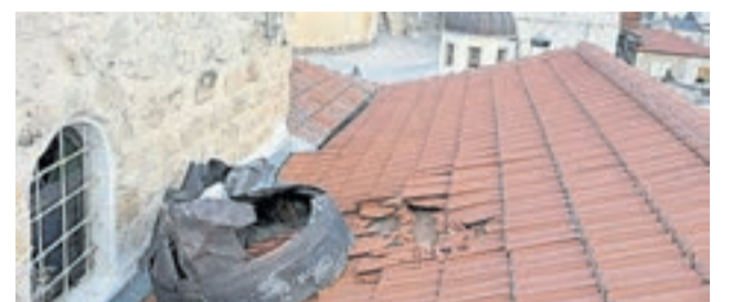
Bomba. A metros de la iglesia cayó una días pasados.