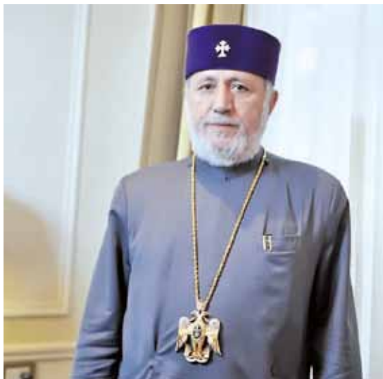
ECUMENISMO. KAREKIN II DESTACÓ SUS “ESTRECHOS VÍNCULOS” CON EL PAPA.

Añade que “la secularización frente a la cual está plantada Europa y demás continentes todavía no es notable, ni es un problema, en nuestro medio. Nuestras iglesias están llenas de fieles. La juventud forma el tronco principal de nues-