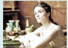
AGORA (española): Crítica del cristianismo antiguo. Estrenada.