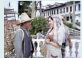
CRISTIADA (mexicana): La revolución mexicana. A estrenar.