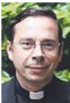
PADRE MARIANO FAZIO EXPERTO EN LA RELACIÓN ENTRE RELIGION Y CULTURA

"Veo esta ola con cierta preocupación porque para muchos el cine y la TV son la realidad".