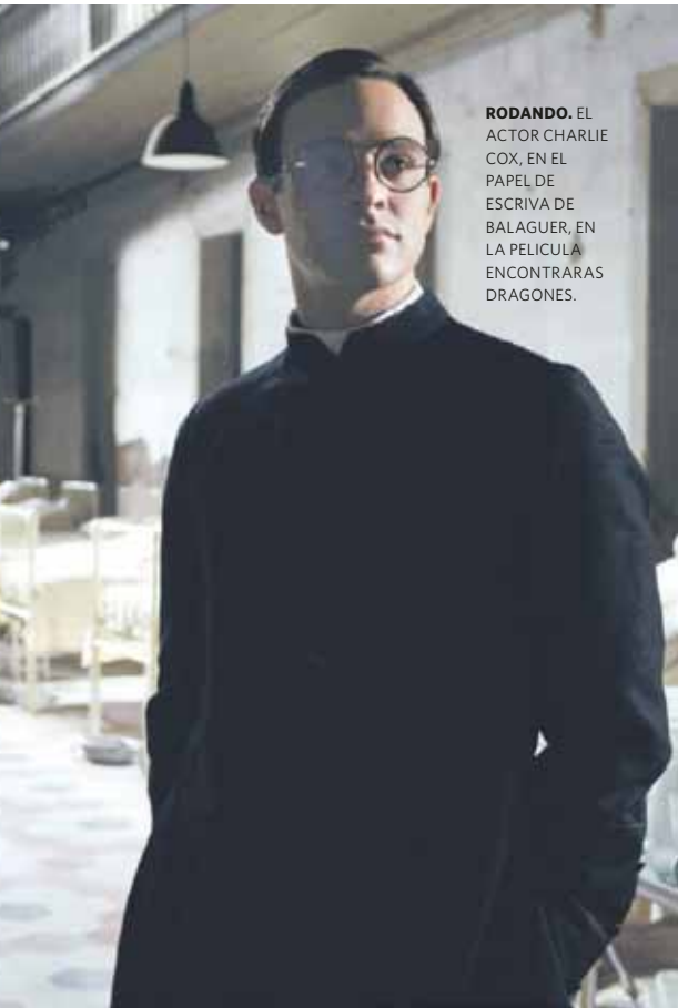
RODANDO. EL ACTOR CHARLIE COX, EN EL PAPEL DE ESCRIVA DE BALAGUER, EN LA PELÍCULA ENCONTRARAS DRAGONES.

porque para muchas personas el cine y la TV reemplazaron la evidencia fáctica: lo que ven les parece la realidad. En algunos casos, pocos, la Iglesia Católica no representa el mal represivo que en el imaginario colectivo fácilmente le toca representar. El saldo debe ser medido en cada caso y, en general, la polémica no es positiva, como sucedió con El Código Da Vinci , porque los bandos contrapuestos no se mueven en el terreno apropiado a los temas espirituales, sino que en realidad deberían cotejar con los hechos históricos que son, en general, poco conocidos. Lo espiritual -puntualiza- es parte de la interioridad, no se presta a debates". No descarta que la Iglesia haga "alguna aclaración pública ante una distorsión de los contenidos de fe, una difamación o directamente una blasfemia". Pero apuesta sobre todo a la preparación ad hoc de los fieles.