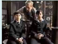
ENCONTRARAS DRAGONES (España): El perdón. A estrenar.