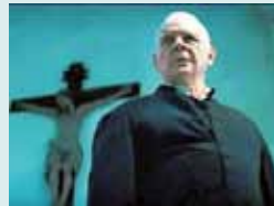
EL RITO (EE. UU.): Las dudas de fe y el exorcismo. Estrenada.