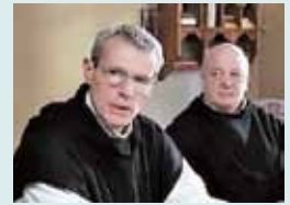
DE DIOS Y HOMBRES (francesa): Martirio. A estrenar.