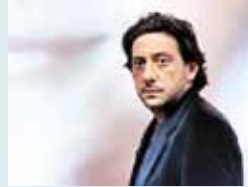
LA SONRISA DE MI MADRE (italiana): Irónica. Estrenada.