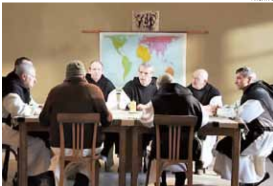
DILEMA. LOS MONJES DEBEN DECIDIR SI SE QUEDAN O SE VAN ANTE EL PELIGRO.